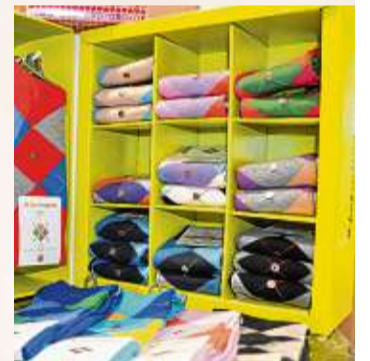
Neu eingetroffen: Die Frühjahrs-Sockenkollektion von Burlington.

ung und wird stetig aufgefüllt. Weitere aktuelle Marken im Sortiment: Triumph, Passionata, Marie Jo, Prima Donna, Anita und Skinny. Ebenfalls stark ausgebaut wurde das Angebot von Triaction Sportwäsche mit modischen Sport-BHs und jetzt auch mit funktionalen Trainings-Leggings. Der Bademodenbereich bietet die aktuellen Modelle der Marken Sunflair, Opera, Marie Jo sowie „Chantelle – Bademode mit französischem Flair“.