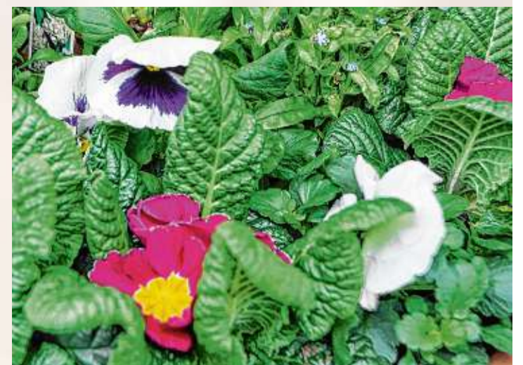
Die schönen und bunten Primeln wecken die Vorfreude auf den Frühling – ein Geschenk, das man sich nicht entgehen lassen sollte.